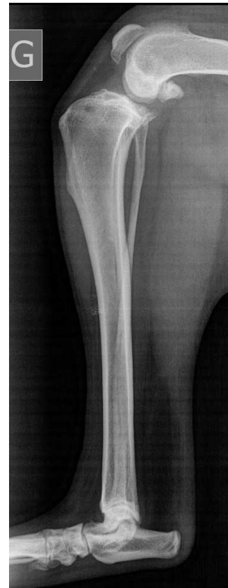
Figure 2 : Radiographie d'un grasset montrant des signes indirects de rupture du LC : synovite, ostéophytose à l'extrémité distale de la rotule et en haut de la trochlée.

Les résultats sont suffisamment satisfaisants par rapport à l'attentisme pour indiquer cette intervention de manière systématique.