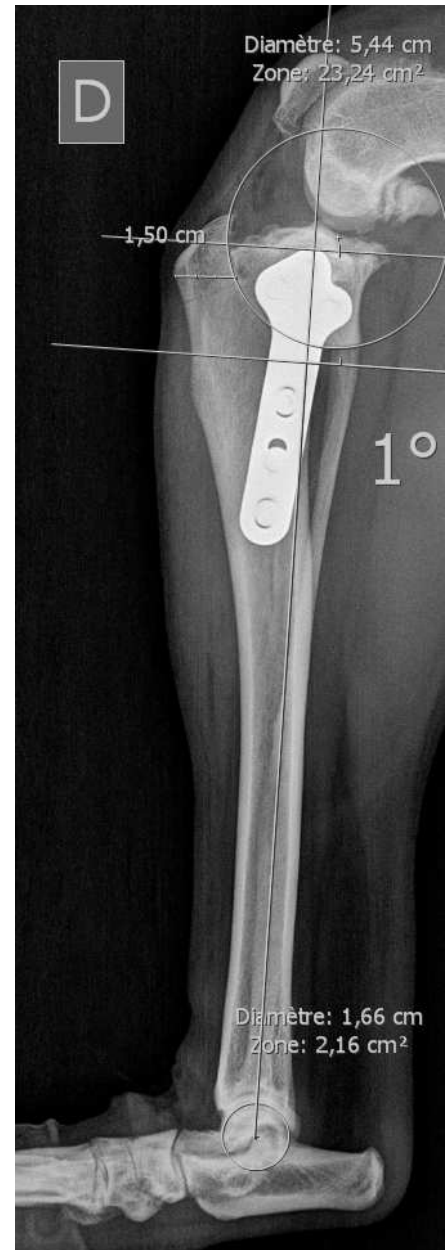
Figure 3 : Résultat post-opératoire d'une chirurgie de TPLO avec une plaque standard Synthes® 3.5 mm